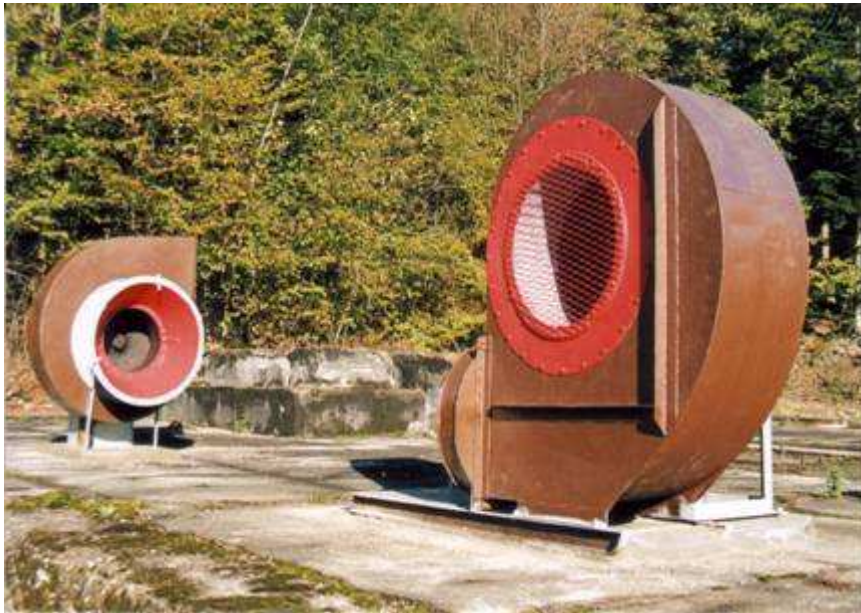
Les 2 ventilateurs de mine

ASSOCIATION DES AMIS DU MUSÉE DE LA MINE