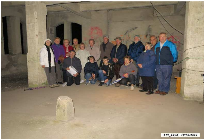
Puits Sainte Marie-Nuit des Musées 2013