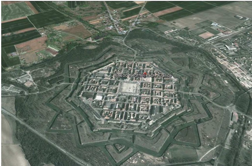
La ville de Neuf-Brisach

SAMEDI 25 JANVIER 2014 LES AMIS DU MUSEE DE LA MINE