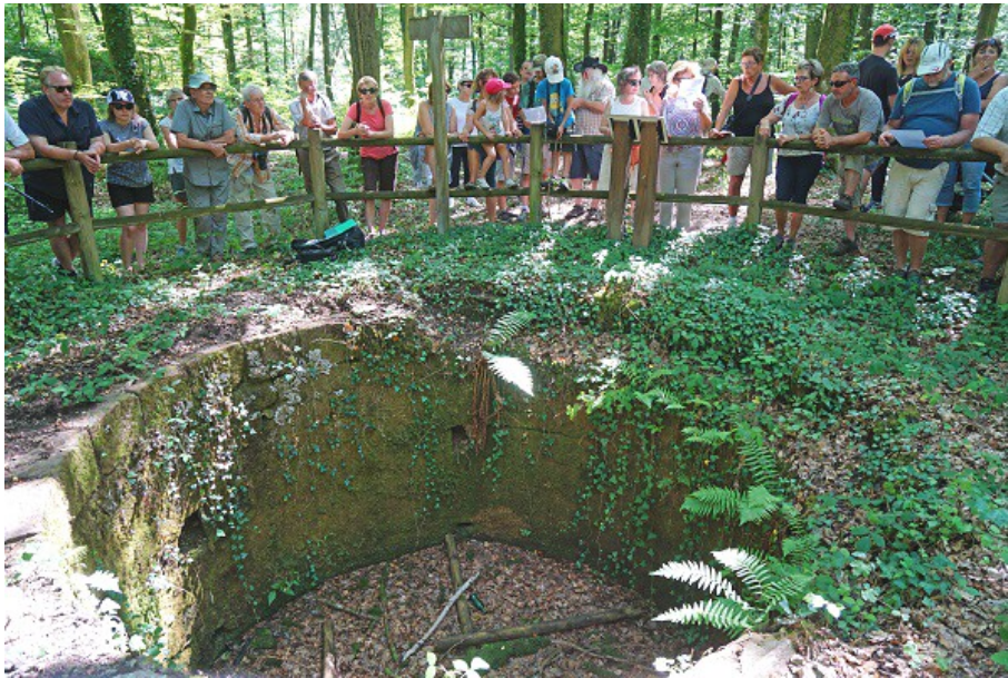
Une soixantaine de personnes ont participé à la sortie sur les traces des houillères de Gouhenans (ici le puits n° 15).