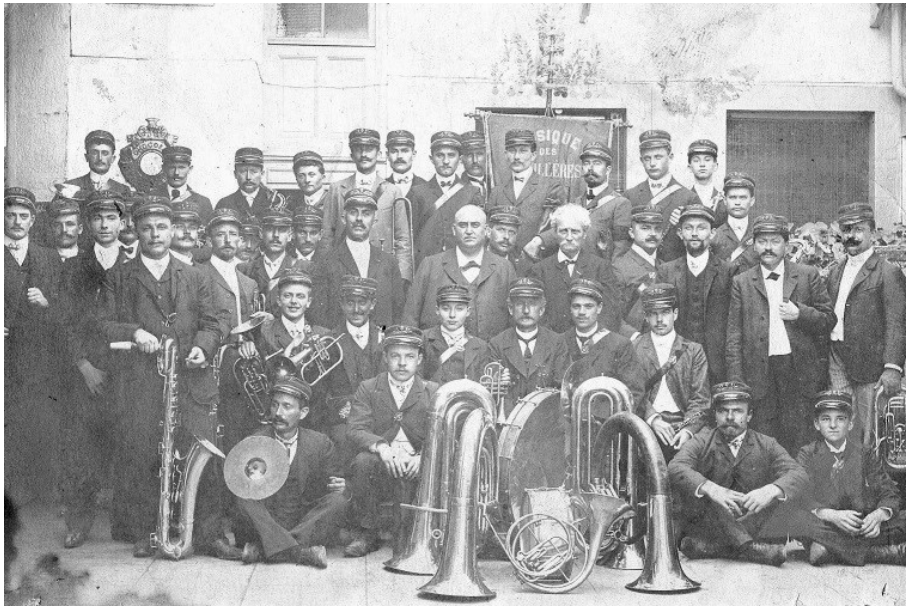
L'harmonie des Houillères de Ronchamp.