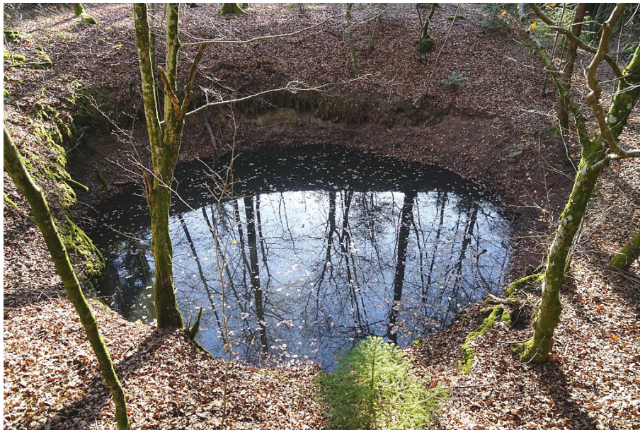
Le puits de la Croix dont il ne reste qu'un modeste terril, un grand trou d'eau bien mystérieux et quelques briques cassées éparses.